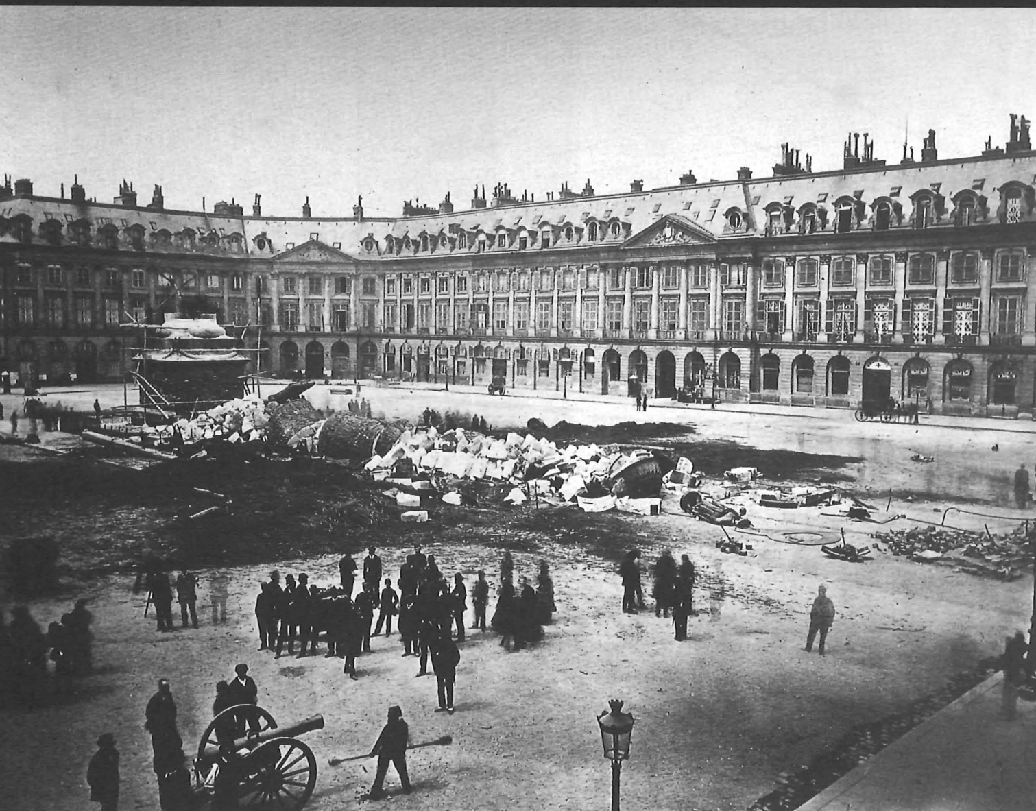
Paris. Demolición de la columna Vendôme (1871). Autor anónimo.