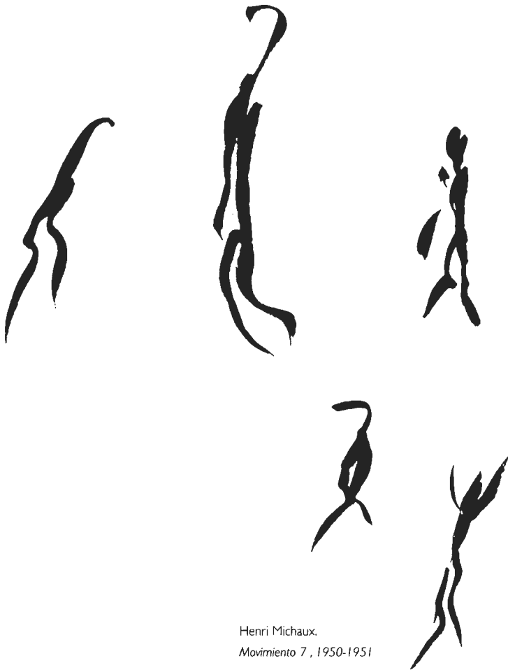
Henri Michaux. Movimiento 7, 1950-1951