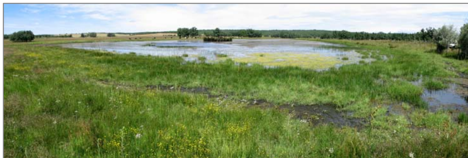
Figura 6. Rabanera del Campo, laguna de la Dehesa