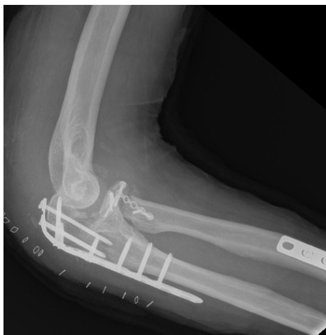
Figura 3. Control postoperatorio tras la nueva osteosíntesis de olécranon con placa.