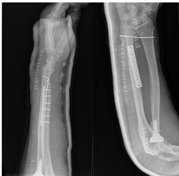
Figura 6. Resultado postoperatorio tras la sustitución de la cabeza del radio por prótesis, fijación distal de la fractura de radio y fijación de la articulación radiocubital distal una vez reducida.