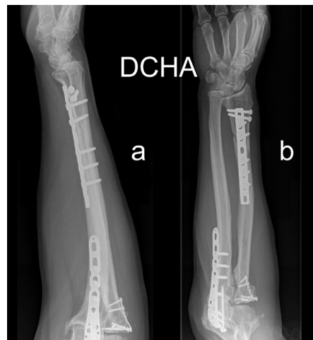
Figura 4. Pérdida de la reducción de la articulación radiocubital distal al retirar la aguja.

limitada 30° en el lado derecho y 20° en el izquierdo. Ambos codos presentan una limitación de 15° de extensión (Fig. 7). La fuerza de prensión medida con dinamómetro JAMAR® (media de 3 tomas consecutivas) es de 28 Kg en la muñeca derecha y de 25 en la izquierda. La fuerza de pinza es de 7 Kg en el lado derecho y 8 en el izquierdo con el mismo sistema de medición. Subjetivamente el paciente se encuentra mejor del lado izquierdo. El resultado del cuestionario DASH fue finalmente de 31 de modo bilateral.