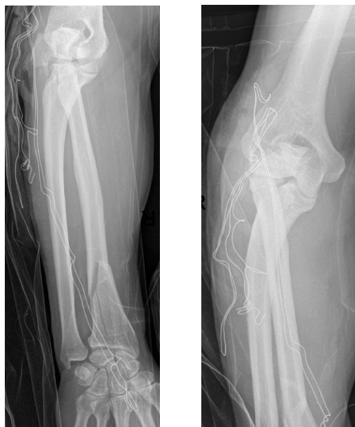
Figura 1. Fractura compleja de Essex Lopresti derecha, con fractura compleja de cabeza de radio y olecranon, fractura distal del radio y luxación radiocubital distal con alargamiento de cúbito.

A los 5 meses de evolución el paciente acude a la consulta con dolor a nivel de la muñeca izquierda quejándose de falta de fuerza en la misma. Se realizan Rx en donde se objetiva fractura conminuta de cabeza de radio, luxación dorsal de la cabeza del cúbito y alargamiento relativo del cúbito (Síndrome de Essex-Lopresti) (Fig 5). Se decide intervención quirúrgica en un tiempo en la que se realiza secuencialmente: artroplastia anatómica de cabeza de radio (Acumed ® ), osteoto-