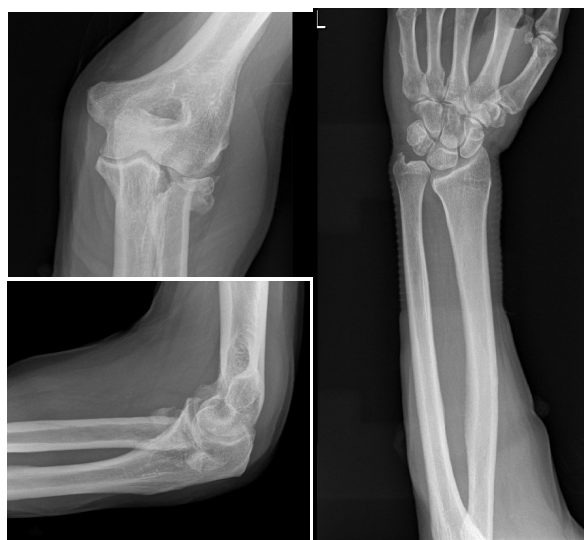
Figura 5. Fractura de cabeza de radio y luxación radiocubital distal en el miembro superior izquierdo.

Actualmente no hay un consenso establecido acerca de cual es el mejor tratamiento para dar una solución definitiva a esta patología, estableciéndose una serie de pautas de actuación en cada una de las zonas afectas,