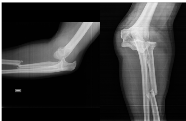
Figura 1. Imagen de radiografía simple en proyecciones de perfil y antero-posterior de codo donde se observó una luxación postero-lateral del codo asociada a fractura diafisaria del radio.

La clasificación de Bado 17 es universalmente aceptada para la descripción de las lesiones de Monteggia, e implica la presencia de fractura de cúbito con o sin fractura de radio, asociada a luxación del codo (Tabla I).