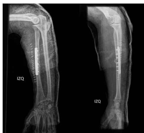
Figura 2. Imágenes de radiografía simple postquirúrgicas donde se observa una buena alineación de los fragmentos, reducción del codo y buena congruencia radiocubital distal.