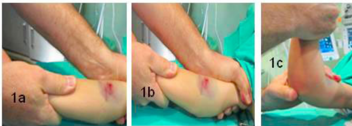
Figura 1. Maniobras de reducción: a. Tracción longitudinal; b. Corrección de traslación; c. Corrección de la extensión.

Autores como De las Heras 9 , introducen alguna modi-