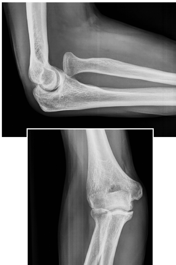
Figura 1. Imagen de radiografía simple de codo en lateral y anteroposterior, donde se observa la luxación anterior aislada de la cabeza de radio.

Paciente varón de 32 años, sin antecedentes médicos ni quirúrgicos de interés que acudió al Servicio de Urgencias de Traumatología tras accidente casual presentando traumatismo directo sobre miembro superior derecho a nivel del codo, provocado por caída desde su propia altura, golpeándose en el codo derecho en flexión. A la exploración física presentaba una leve tumefacción del codo con dolor a la palpación en olécranon y cara externa, sin afectación clínica neurovascular distal. La movilidad del codo presentaba una extensión completa, flexión limitada 30° y pronosupinación discretamente limitada.