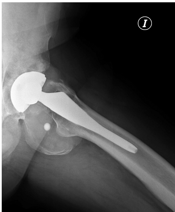
Figura 1. Radiografía simple axial que muestra la masa quística "calcificada" y una pequeña masa de características metálicas en su interior.

gen permaneció sin cambios durante once meses, tras los cuales apareció una pequeña imagen de apariencia metálica en el interior de la masa "calcificada" (Fig. 1).