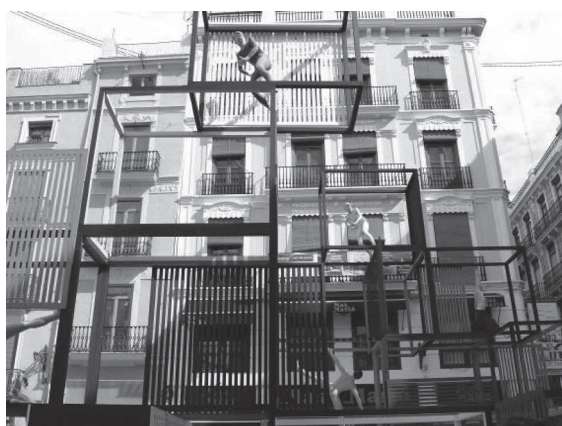
El joc geomètric dels cubs transparents dissenyats per Anna Ruiz es combina de manera radical amb l'arquitectura de la plaça, imprimint transparència.

L'artista va voler deixar espai lliure per al trànsit de les persones, que finalment s'acaben incorporant com a transeünts al mateix monument, ja que les figures (ninots) eren de les dimensions del públic, i per tant combinaven a la perfecció en aquest joc de danses i trànsits entre persones i personatges. Al terra hi ha un enorme tapís groc, sobre el qual trobem textos d'escriptors i comentaris literaris al voltant de la dansa, de les pors i de les visibilitats. El tractament conceptual és sempre molt meticulós en les obres d'Anna Ruiz, artista llicenciada en Belles Arts, que també disposa d'un important bagatge en història de l'art. El seu és més prompte un concepte d'art públic, una pràctica artística dins de l'espai públic, i per tant ens trobem davant d'una mirada que, si bé està immersa en la dinàmica de les falles, ens acosta sigil·losament a la pràctica artística contemporània de caràcter radical. Si voleu més informació de les seues propostes la podeu trobar en l'enllaç < www.flickr.com/photos/anna_ruiz/ >.