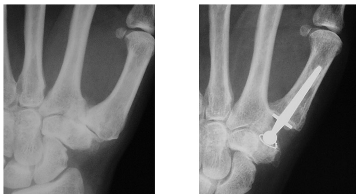
Figura 2: Radiografía anteroposterior de mano izquierda con prótesis De la Caffinière. 15 años de evolución satisfactoria.