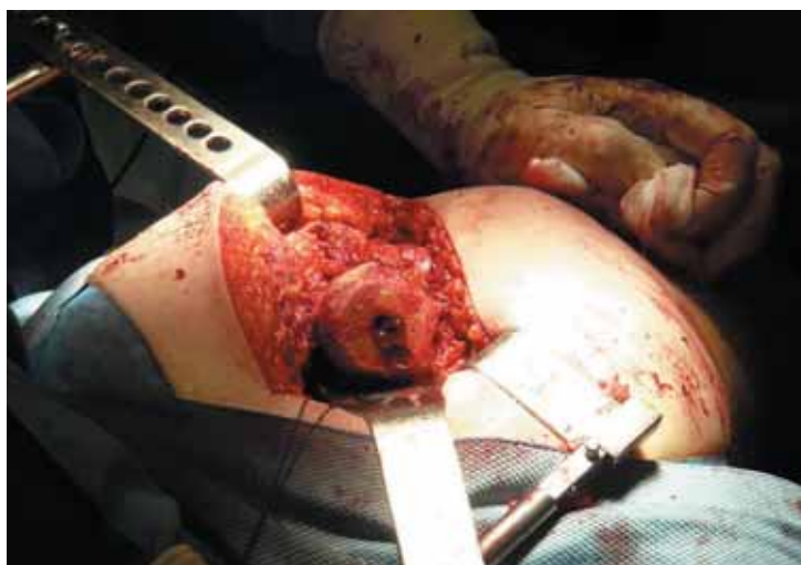
Figura 10. Técnica quirúrgica: Aspecto de la cabeza femoral tras finalizar su fresado

cabeza y cuello femorales, ya que es necesario mantener la integridad del cuello 12,13 . En los pacientes con una geometría aberrante de la cabeza y cuello femorales, debidas a enfermedad de Legg-Calvé-Perthes (LCP) o Epifisiolisis femoral proximal (EFP), este procedimiento es todavía más exigente.