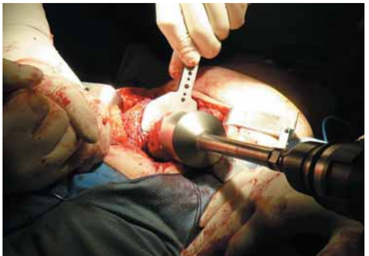
Figura 8. Técnica quirúrgica: fresado para reducci3n de la cabeza femoral.