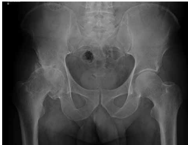
Figura 1. Imagen radiológica anteroposterior prequirúrgica de pelvis.

Los parámetros radiológicos medidos pre y postoperatoriamente fueron la relación cuello/cabeza femoral y "offset" anterior, posterior y lateral de la cabeza femoral.