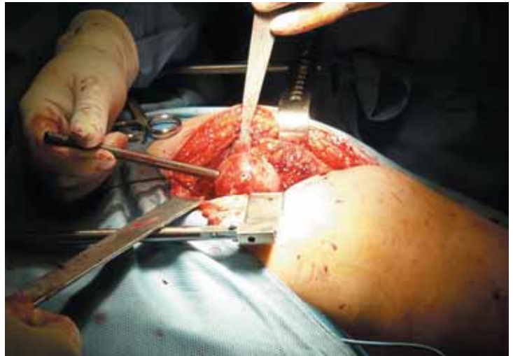
Figura 7. Técnica quirúrgica: instrumentaci3n sobre la aguja guía.