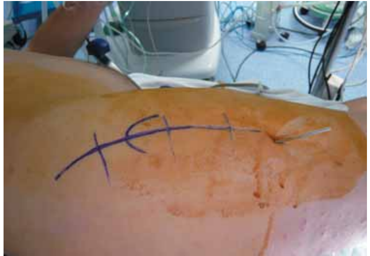
Figura 6. Imagen quirúrgica con aguja guía colocada percutáneamente.

Se trata de una intervenci3n que entraña una dificultad técnica en pacientes con una anatomía normal de la