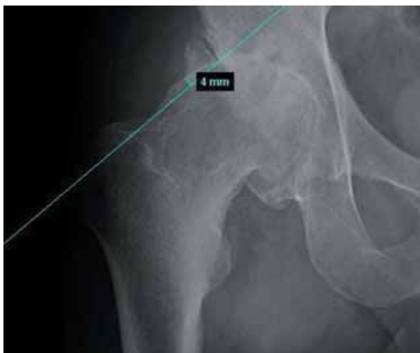
Figura 5. Offset superior en radiografía anteroposterior.

Para la medición del diámetro de la cabeza y cuello femoral se utilizó el programa informático Ikonos . La relación cabeza/cuello se calculó dividiendo el diámetro de la cabeza por la anchura del cuello en su punto medio 5 , (Fig. 3).