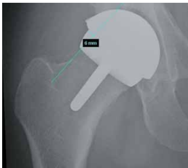
Figura 11. Imagen radiológica a los 3 meses de evolución, en anteroposterior, corrección offset superior.

Los resultados obtenidos en nuestro caso pueden asimilarse a los publicados por otros autores como Ams-