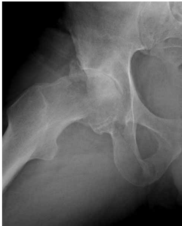
Figura 2. Imagen radiológica axial prequirúrgica cadera derecha.