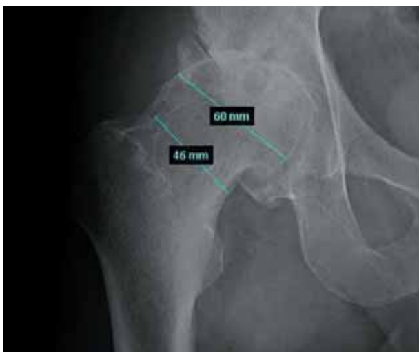
Figura 3. Relación cabeza-cuello femoral.