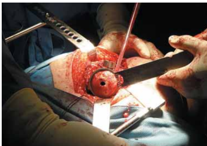
Figura 9. Técnica quirúrgica: corte superior sobre la cabeza femoral.