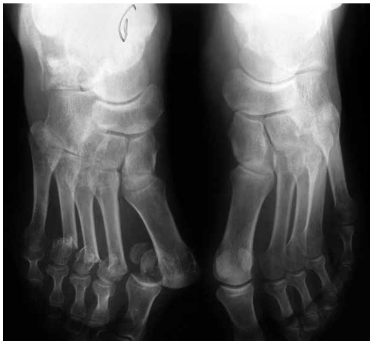
Figura 2: Fractura de metatarsianos pie derecho y luxación metatarso falángica del primer dedo.

La evolución aunque lenta, fue satisfactoria y aproximadamente a las 6 semanas se retiraron clavos y agujas, iniciando la rehabilitación. Se mantuvo la abstención de apoyo hasta los 3 meses de la fractura, empezando después la deambulacion con plantillas de soporte plantar. El resultado radiográfico fue bueno en metatarsianos pie derecho y calcáneo izquierdo y aceptable en el calcáneo derecho (Fig. 5). A la exploración movilidad prácticamente a límites en ambos pies, sin dolor, con pie izquier-