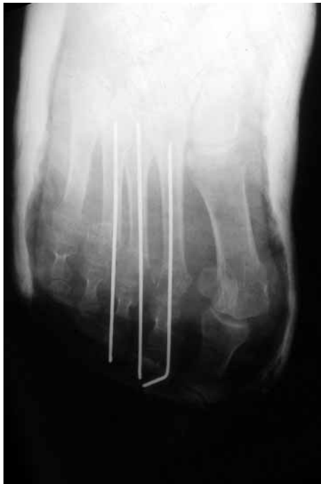
Figura 4: Control radiográfico postoperatorio de fracturas de metatarsianos pie derecho y luxación metatarso falángica del primer dedo.