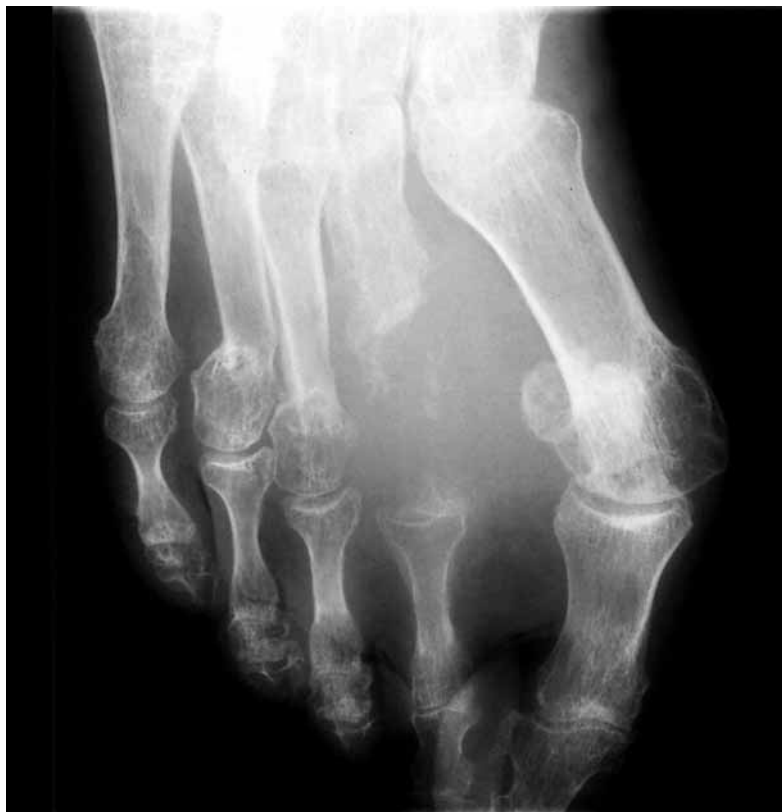
Figura 6: Estudio radiográfico de la tumoración del pie derecho, observando la afectación del II metatarsiano.

Las intervenciones realizadas al paciente para el tratamiento de las fracturas de los metatarsianos, se realizaron de forma directa percutánea desde la cara plantar, debido al gran edema y afectación de la integridad cutánea que desaconsejaba un acceso directo, no detectándose el proceso expansivo. De forma retrospectiva, pensamos que seguramente si las condiciones lo hubieran permitido, se hubiera realizado la intervención mediante enclavijado de las fracturas de los metatarsianos de forma retrógrada a través de incisiones en el dorso del pie y quizás se hubiera podido visualizar una tumoración expansiva en el espacio intermetatarsal dado que la evolución de esta tumoración es lenta hasta las fases finales