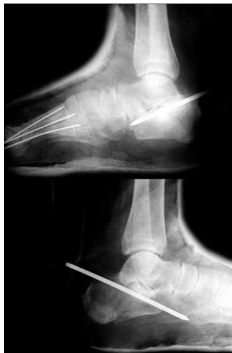
Figura 3: Tratamiento de ambas fracturas de calcáneo.