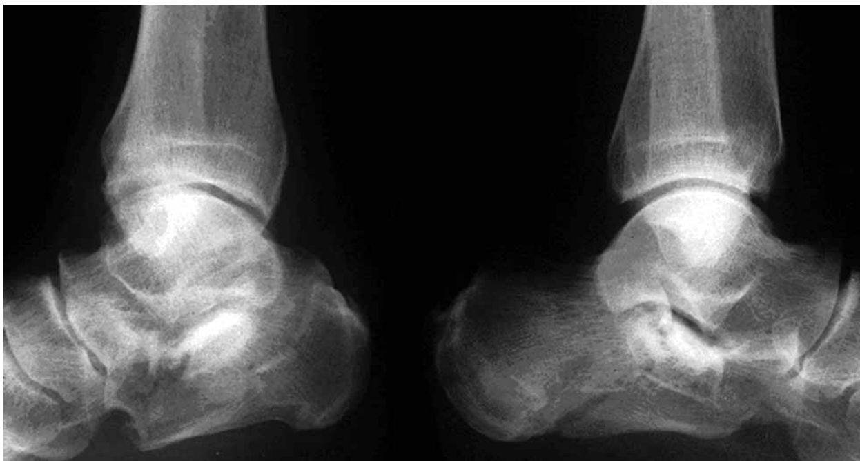
Figura 1: Fractura de ambos calcáneos.

alrededor del 20-30% de los casos (5). En caso de invasión tumoral en el hueso éste puede presentar destrucción franca entre el 5 y 20 % de los pacientes (3). La gammagrafía capta de forma marcada. La imagen en RNM es inespecífica y muestra una tumoración no homogénea con septos y en caso de invasión en vecindad infiltra los márgenes. Presenta señal baja en T1 y brillo homogéneo en T2 (8).