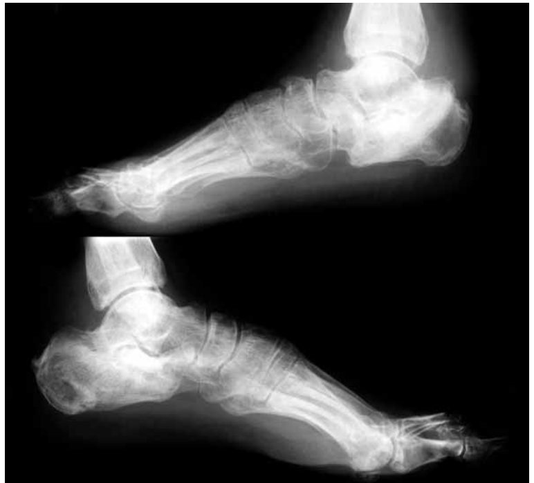
Figura 5: Resultado final radiográfico de las fracturas de calcáneo.

do de aspecto normal y talón ensanchado en pie derecho. La deambulación sin cojera e indolora hacía que el paciente estuviera satisfecho.