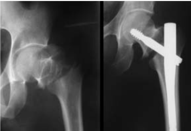
Figura 3. Caso 2. Izquierda: Varón 43 años, fractura pertrocanterea A3.2 AO/OTA. Derecha: osteosíntesis mediante clavo Gamma. Distracción foco fractura.