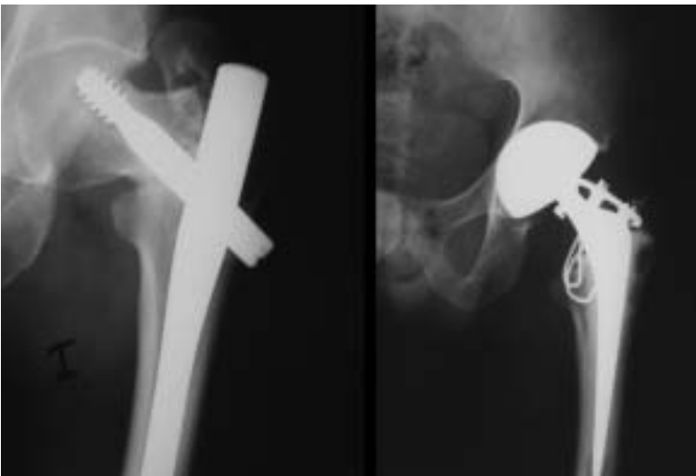
Figura 3. Caso 2. Izquierda: pseudoartrosis con "cutout". Derecha: rescate mediante artroplastia total de cadera híbrida con cerclaje el trocánter mayor.

berculosis y neumonías de repetición. Acude a Urgencias refiriendo caída casual en calle con traumatismo sobre el miembro inferior izquierdo seguido de dolor e impotencia funcional para la deambulación. A la exploración se aprecia actitud del miembro inferior izquierdo en rotación externa y acortamiento con dolor al intento de movilización. En la radiografía se aprecia una fractura pertrocanterea tipo A3.2 de la AO/OTA (Fig. 3 Izq.).