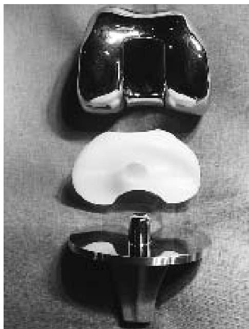
Figura 1. Imagen de los componentes de la prótesis Performance postero-estabilizada.

Resultados. A los seis meses de evolución la flexión media del grupo PF era de 106^\circ + 15^\circ y la del grupo PR era de 106^\circ + 12^\circ . Al año de evolución la movilidad de ambos grupos seguía en torno a 105^\circ + 10^\circ sin que se evidenciaran diferencias estadísticamente significativas entre ambos grupos. En dos casos se detectó un déficit de movilidad que requirió movilización bajo