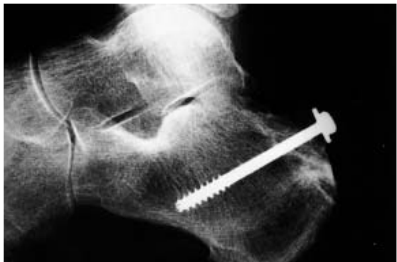
Figura 9. Control radiográfico del tobillo izquierdo del caso 5 obtenida en la fecha de la última revisión en consulta.

- Flexión dorsal violenta del pie en un momento de máxima flexión plantar del mismo, como ocurre típicamente en una caída de altura (1,9).