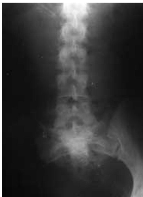
Figura 4. Hemipelvectomía.