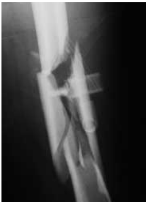
Figura 2. Fractura diafisaria conminuta de femur. Son habituales las lesiones asociadas, siendo especialmente frecuentes las fracturas de huesos largos por alta energía.

Además suelen acompañarse de lesiones en otros aparatos (3,4,8,9), como son el di-