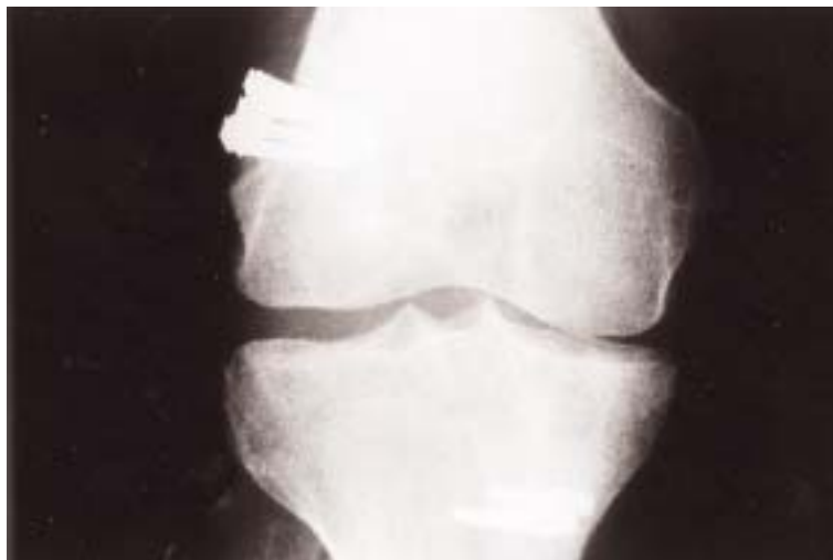
Figura 1. Radiografía AP inmediatamente después de la intervención quirúrgica donde se observa el anclaje del ligamento.