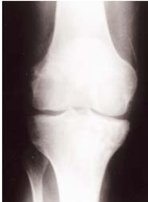
Figura 4. Radiografía AP postoperatoria, después de la extirpación del quiste y aporte del injerto óseo.

Discusión. La prótesis de “Leeds-Keio” ha sido usada frecuentemente durante años para tratar las lesiones del ligamento cruzado anterior. Los resultados iniciales comunicados a principios de los ochenta por Fujikawa (5) fueron excelentes, su colocación era fácil, la rehabilitación precoz, y la movilidad de la rodilla completa en la mayoría de los casos, a diferencia de lo comunicado cuando se usaba injerto del tendón patelar,