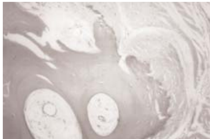
Figura 6. Tejido óseo parcialmente reemplazado por fibras de colágena, con escasa actividad osteoblástica (Hematoxilina-eosina x 100).