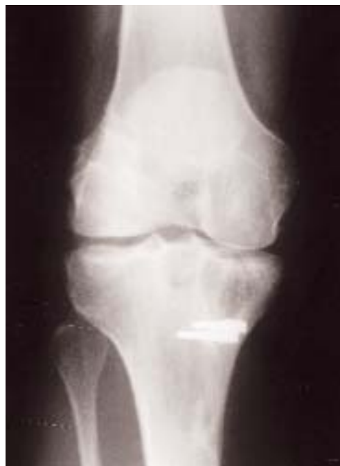
Figura 2. Radiografía AP, tres años después del implante del ligamento, se aprecia quiste óseo subcondral que ocupa la práctica totalidad del platillo tibial interno.

sa de cuerpo extraño (Fig. 5 y 6). Seis meses después de la intervención, la movilidad de la rodilla era satisfactoria, y no existía inflamación, aunque el paciente notaba un pequeño dolor en la rodilla durante su trabajo, y tuvo que abandonar la práctica deportiva. Actualmente ocho años después, el injerto óseo se ha incorporado en la tibia, y el paciente permanece con los mismos síntomas.