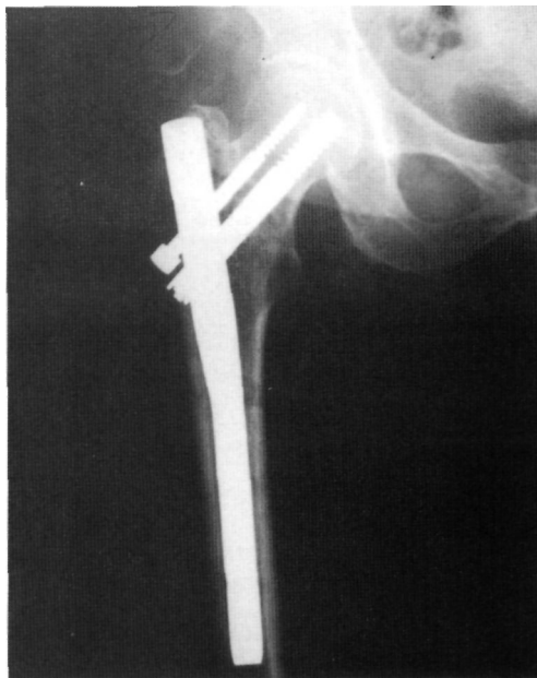
Figura 1. Fractura pertrocanterea tratada con el clavo Clauffitt.