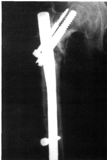
Figura 3. Migración del tornillo cefálico fuera de la cabeza del fémur.

Las complicaciones intraoperatorias aparecidas en nuestra serie con este implante, creemos que siguen debiéndose a errores de técnica, como ocurría con el clavo Gamma (15); sin embargo, a diferencia del Gamma, no hemos observado fracturas diafisarias ni del trocánter mayor y tampoco roturas de la cortical lateral (3,4,7,8,12,13,15-23). A este hecho contribuirían tanto el diseño del clavo como la experiencia en nuestro Servicio con el clavo Gamma que facilitaría la curva de aprendizaje con el nuevo implante.