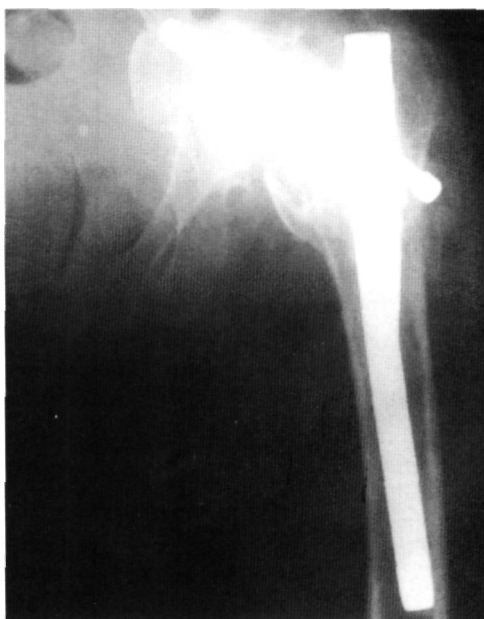
Figura 4. Protrusión por deslizamiento de los tornillos cefálicos en cotilo.

Las complicaciones postoperatorias descritas con el clavo Gamma, que pueden considerarse como las más relevantes, son las fracturas diafisarias y la migración del tornillo cefálico fuera de la cabeza femoral. La incidencia de fracturas con este implante se sitúa entre el 0-16% (2,3,4,7,12,13,17-22,24-26) y la de migraciones del tornillo cefálico entre el 0-8% (2,3,7,11-13,15,18-24,26). El porcentaje de fracturas diafisarias en nuestra