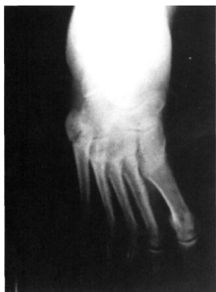
Figura 2. A las 6 semanas de evolución, donde se aprecia un aumento de la distancia entre los dos fragmentos. Nótese el adductus del mensaje.

Por su parte el músculo peroneo anterior se inserta en la porción lateral de la diáfisis del 5º metatarsiano distal a la tuberosidad.