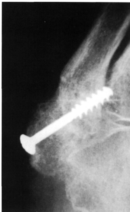
Figura 5. Radiografía a los 3 meses de evolución con la fractura consolidada.

La consideración anatómica de la región pone de manifiesto la existencia de tres articulaciones (cuboides-5º metatarsiano; cuboides-4º metatarsiano; 4º-5º metatarsianos), por lo que un porcentaje variable de estas lesiones afectaran a alguna de las mismas y como fracturas articulares deben ser reducidas anatómicamente. De la misma manera hemos de tener en cuenta la existencia de un núcleo secundario de osificación en pacientes jóvenes que se une radiográficamente a la diáfisis del metatarsiano antes de los 14 años, y que deben diferenciarse de las fracturas-avulsiones (8). La posible presencia de huesos sesamoideos (os peroneum en el espesor del tendón del peroneo lateral largo; os vesalium en el espesor del tendón del peroneo lateral corto) en la vecindad del extremo proximal del 5º metatarsiano obliga a realizar una cuidadosa valoración radiográfica del pie.