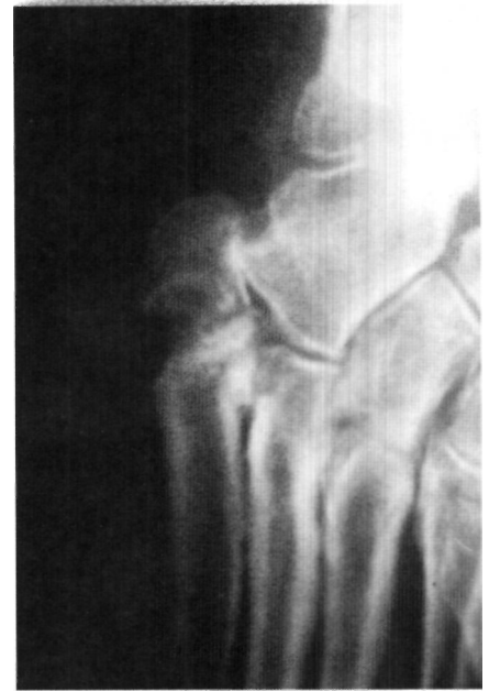
Figura 3. Radiografía a los 6 meses de evolución. Se observa un amplio espacio entre los fragmentos y esclerosis del canal medular en el fragmento distal.

Discusión. El análisis cuidadoso del tipo de fractura en la imagen radiográfica nos puede evitar en numerosas ocasiones incidentes desagradables. Durante mucho tiempo estas fracturas se clasificaban como fracturas de la extremidad proximal del quinto metatarsiano y se denominaban "fracturas de Jones".