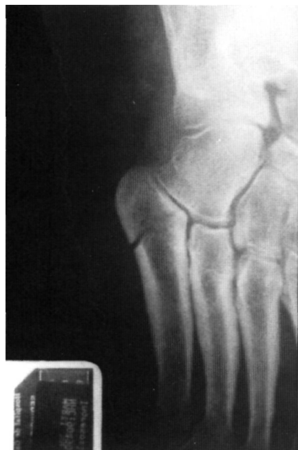
Figura 1. Radiografía inicial donde se aprecia trazo de fractura que afecta a la articulación metatarso-cuboidea.