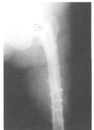
Fig. 4A. Radiografía postoperatoria, se aprecia una reducción anatómica.