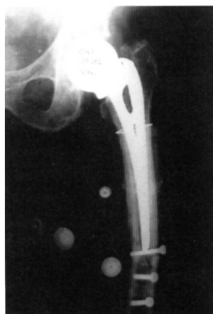
Fig. 4B. Radiografía en que se aprecia varización a nivel de la punta del vástago a los 4 meses del tratamiento inicial.