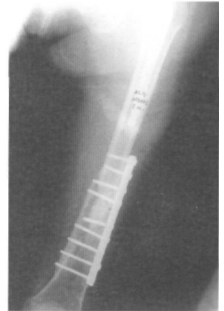
Fig. 3B. Radiografía después del tratamiento mediante extracción del material de osteosíntesis, decorticación y nueva osteosíntesis.

El empleo exclusivo de cerclajes y tornillos en general no ofrece seguridad suficiente para el tratamiento de estas fracturas (12,18,19). Los cerclajes de alambre solos pueden ser adecuados si el vástago está firmemente anclado y la fractura no está desplazada (11,20). Tienen como inconveniente que no permiten una rápida rehabilitación del enfermo (11). En nuestra serie se