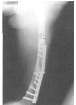
Fig. 3A. Radiografía de rotura de material de osteosíntesis y varización de la fractura a los 15 meses del tratamiento inicial.