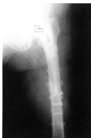
Fig. 6. Radiografía del resultado del tratamiento de una fractura tipo II de Johansson con recambio por un vástago largo y cerclajes.

emplearon en 2 casos tornillos de compresión, añadiéndole bandas de Partridge, en uno de los casos ocurrió una pérdida de reducción a los dos meses de la intervención que obligó a iniciar de nuevo el tratamiento de la misma (Fig. 4A y 4B).