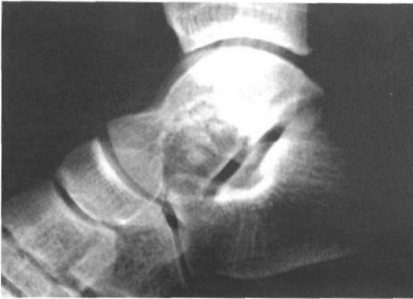
Figura 3. Rx lateral de astrágalo derecho en la que se evidencia erosión de la porción inferior del cuello y cabeza.