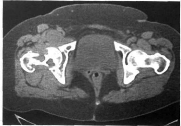
Figura 5. T.A.C. de ambas caderas en donde se puede observar lesiones líticas en cuello, cabeza y cotilo (corresponde al paciente de la figura 1).