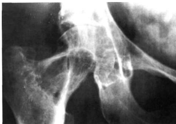
Figura 1. Rx anteroposterior de cadera derecha con afectación ósea en cuello, cabeza femoral y cotilo.

Se realizó a todos los pacientes un examen radiológico convencional. En 5 (38%) casos se observó afectación de los extremos óseos: en la cadera aparecieron lesiones líticas subcondrales en espejo a ambos lados de la articulación junto a una disminución de la interlínea articular (Fig. 1). En una de las muñecas se observaron imágenes quísticas en los huesos carpianos y extremidad distal del cúbito y radio (Fig. 2). En el astrágalo se observaron geodas del mismo tipo en dos pacientes (Fig. 3), y erosiones en 1. a y 2. a falanges del tercer dedo del pie, en los otros casos (rodi-