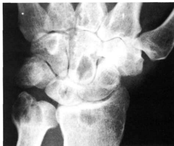
Figura 2. Rx anteroposterior de muñeca izquierda, se aprecian imágenes quísticas en epífisis distal del cúbito y radio, así como en huesos semilunar, escafoides y grande.

lias y codo), sólo se pudo apreciar un ligero aumento de la densidad de las partes blandas.