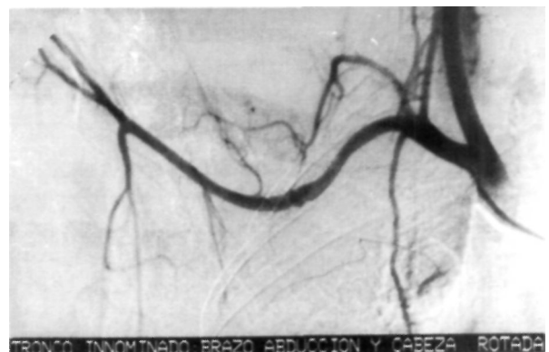
Figura 3. Arteriografía de la arteria subclavia al realizar la maniobra de Adson. Se puede apreciar la compresión de la arteria subclavia entre la primera costilla y el foco de pseudoartrosis.