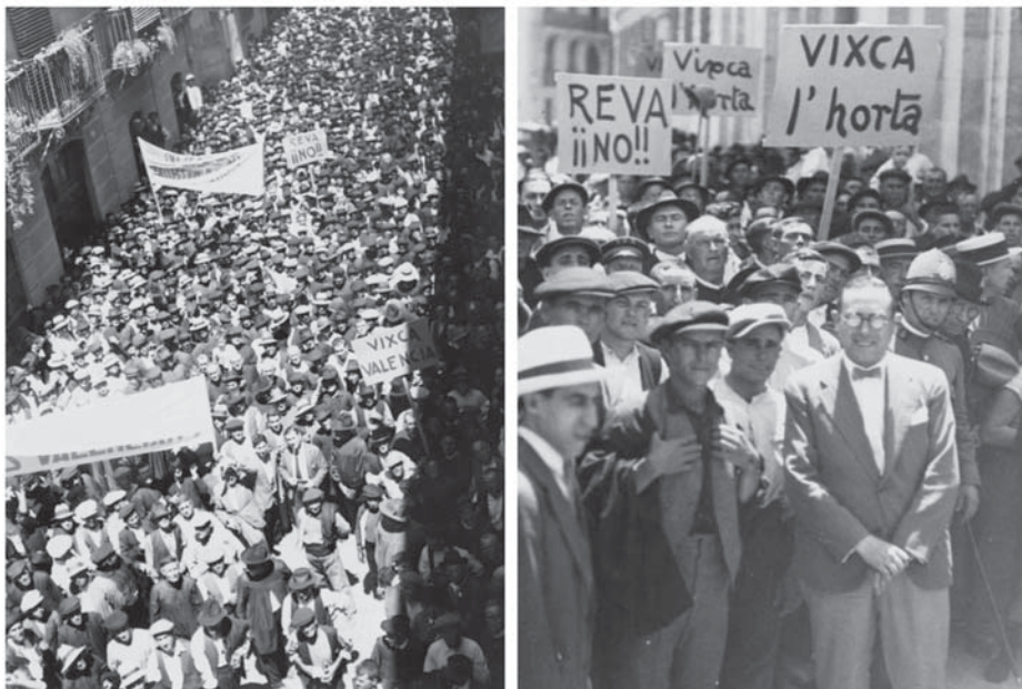
Figuras 2, 3 y 4. Imágenes de la manifestación de Valencia (Biblioteca Valenciana Nicolau Primitiu, Arxiu Giner Boira).