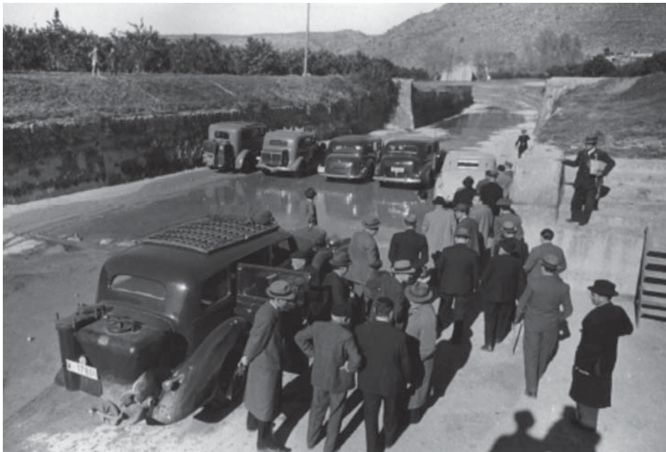
Figura 2. Visita de autoridades durante los trabajos de monda y revestimiento en la Acequia Real del Júcar (1944).

hidráulicas en el Segura, etc.) 34 . Para los síndicos de la Acequia, el ensanche, el revestido y la rectificación pretendían aumentar la capacidad del canal: adecuar el canal a la mayor dotación resultante de la futura regulación del río en Alarcón 35 . La superficie regada por la Acequia pasó de menos de 200.000 hanegadas (16.620 hectáreas) en el primer tercio del siglo, a 233.000 (19.362 hectáreas) en 1953, hasta llegar a casi 300.000 hanegadas (24.930 hectáreas) en las décadas siguientes 36 . Las obras duraron muchos años y representaron un gasto excepcional para la Comunidad porque, en realidad, sólo el 30% del dinero era público 37 . A este desembolso anual se añadían las derramas, aún más altas, para la construcción del pantano en Alarcón 38 . ¿Por qué los regantes afrontaron un esfuerzo tan grande, y sin ayuda del Estado, para un embalse situado muchos kilómetros aguas arriba?