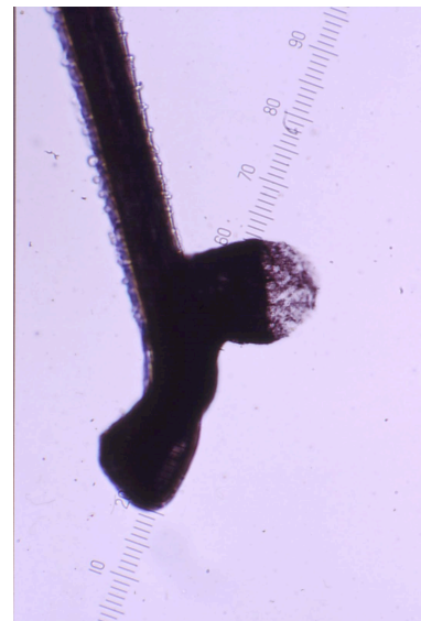
Lesiones en pelo producidas por fulguración.

Imágenes cedidas por los Dres E.Pérez Pujol y V.