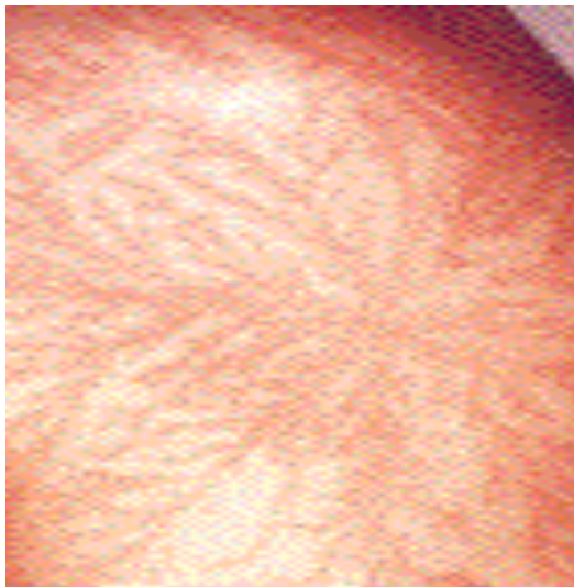
Arborización de Lichtenberg

piel. La marca suele aparecer alrededor de 1 hora después de la descarga y desaparece gradualmente en las 24 horas siguientes. Resnik y Wetli 24 , realizaron el estudio histopatológico de esta lesión apreciándose tan sólo una extravasación focal de hematíes en tejido subcutáneo, no observando lesiones a nivel de epidermis o dermis. La congestión de los vasos subcutáneos puede explicar la coloración marrón y en ocasiones eritematosa de las lesiones, pero su rápida resolución es un misterio.