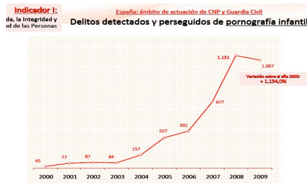
Figura 2. Evolución Delitos detectados y perseguidos de pornografía infantil.

Entre enero y septiembre de 2010 se detectaron mediante un software policial más de 400.000 archivos susceptibles de contener pornografía infantil.