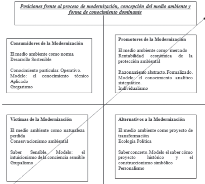
Cuadro 3. Posiciones frente al proceso de modernización, concepción del medio ambiente y forma de conocimiento dominante.

Sociologías, Porto Alegre, año 16, nº 35, jan/abr 2014, p. 166-201