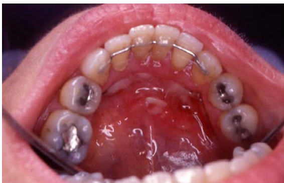
Fig. 2. Ulceraciones en el suelo de la boca tras la administración de alendronato.

Desde hace 4 años se han ido publicando numerosos casos de una forma especial de osteonecrosis de los maxilares (ONM) en pacientes que estaban en tratamiento con BFF de alta efectividad, preferentemente con pamidronato y zolendronato y más raramente con alendronato y afectos de mieloma o cáncer de mama (47-50).