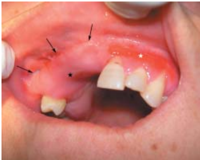
Fig. 2. Paciente 1. Reconstrucción del defecto con colgajo miomucoso de buccinador. Imagen a los 3 meses post-cirugía. La estrella negra señala el colgajo. Las flechas señalan el límite anterior del colgajo. La estrella blanca señala una zona de cicatrización por segunda intención, tras resección de encía que contenía lesiones de melanosis mucosa. Patient 1. Reconstruction of the defect by means of a buccinator myomucosal flap. Image obtained 3 months after the resective surgery. Black star points the flap. Arrows point the anterior limit of the flap. White star points a scarring zone by second intention after resection of gingival mucosal melanosis.

inferior izquierda y encía inferior derecha. El postoperatorio transcurrió sin complicaciones.