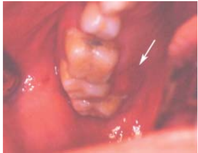
Fig. 3. Paciente 2. Melanoma amelanótico en región palatina-encía maxilar posterior. La flecha señala el límite medial de la lesión. Patient 2. Amelanotic melanoma in posterior maxillary palatal region. Arrow points the medial limit of the lesion.

Siete meses después, en el seguimiento, se objetivó una pigmentación melánica a nivel de mucosa gingival y palatina del maxilar superior. Ante una nueva biopsia que confirmó el diagnóstico de recidiva de melanoma de mucosa oral, se decidió intervención quirúrgica con maxilectomía parcial desde el primer premolar derecho hasta el incisivo central derecho, incluyendo encía insertada, mucosa vestibular y palatina y piezas dentales. En el mismo tiempo quirúrgico se procedió a la reconstrucción del