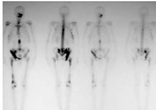
Fig. 3. Gammagrafía: Se objetiva incremento del trazador en hueso maxilar superior izquierdo; pelvis derecha; parrilla costal derecha y séptima vértebra dorsal. Gammagraphy: tracer capture is appreciated in upper left maxillary bone, right pelvis, right costal parry and seventh dorsal vertebra.