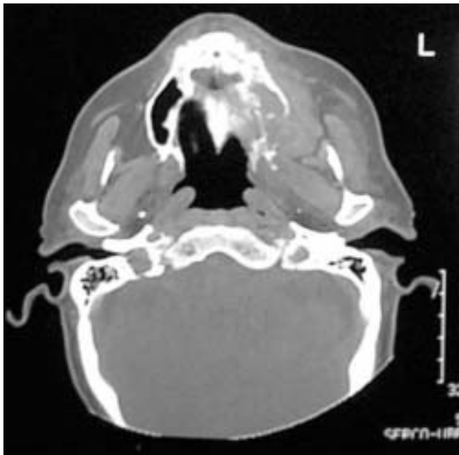
Fig. 1. TC: Imagen del tumor invadiendo hueso maxilar superior izquierdo, paladar duro y apófisis pterigoides. CT imaging which shows destruction of upper left maxillary bone, hard palate destruction and pterygoid apophysis.

Se realizó estudio radiológico simple a través de ortopantomografía y Waters apreciando imagen de osteólisis a nivel de hueso maxilar superior izquierdo e imagen de ocupación en seno maxilar izquierdo. Se procedió a toma de biopsia de la lesión intraoral, informando el anatomopatólogo de metástasis de adenocarcinoma de esófago. El paciente fue ingresado para descartar que presentase más metástasis y delimitar la extensión de la metástasis de hueso maxilar. La exploración cervical para valorar el estado de las cadenas ganglionares fue negativo. Se realizó TAC orofacial, apreciando destrucción de maxilar superior izquierdo con afectación de paladar duro, apófisis pterigoides (figura 1), seno maxilar izquierdo, con rotura de pared posterior y de pared interna de seno maxilar izquierdo (figura 2), existiendo afectación del espacio masticador izquierdo, y estando la lesión tumoral muy próxima al suelo de la órbita izquierda. Se realizó estudio ecográfico abdominal y estudio radiológico simple de tórax siendo informado como normal.