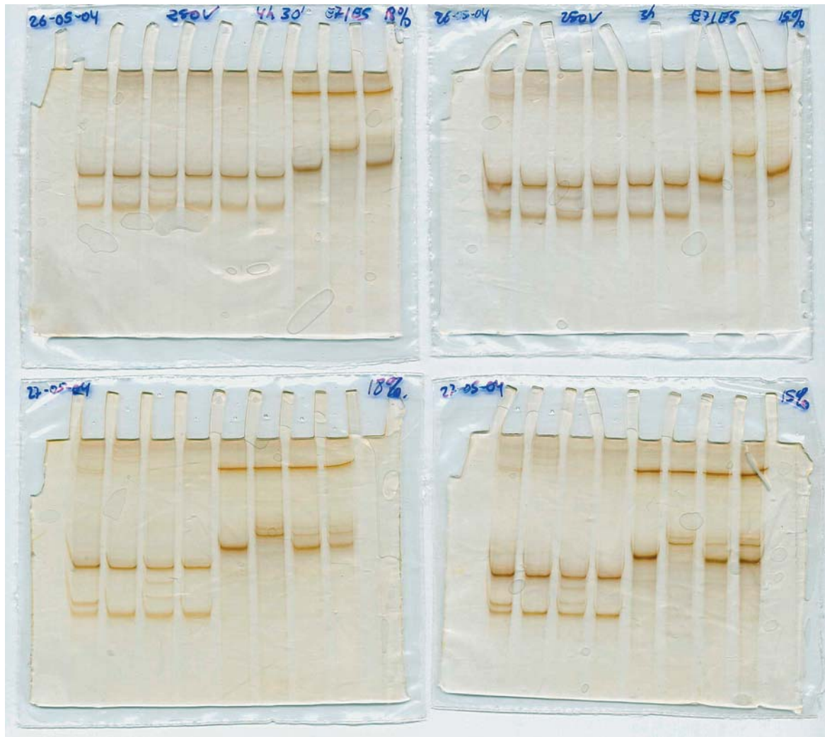
Fig. 3. Detección de mutaciones en el gen p53 mediante la técnica SSCP (análisis de polimorfismo de conformación de hebra única) en geles de poliacrilamida a partir de muestras citológicas orales. p53 mutations detection by SSCP method (single strand conformation polymorphism) in polyacrilamide gels using oral cytologic samples.