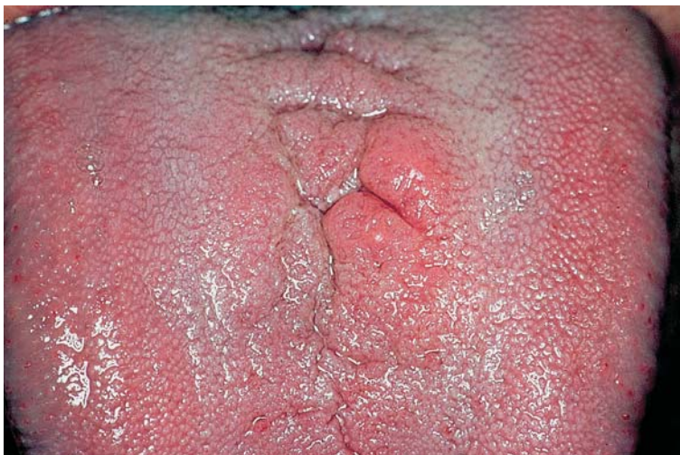
Fig. 3. Aspecto final de la lesión, después del tratamiento antifúngico, menos elevado y menos eritematoso. Appearance of the lesion after antifungal treatment. The lesion is less raised and less erythematous than in Fig. 1.