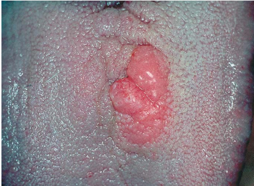
Fig. 1. Aspecto inicial de la lesión: mamelonada y eritematosa, a nivel paramedial izquierdo, 3 cm por delante de la "V" lingual. Initial appearance of the lesion: mamillated and erythematous, left paramedial position, 3 cm anterior to the lingual "V".