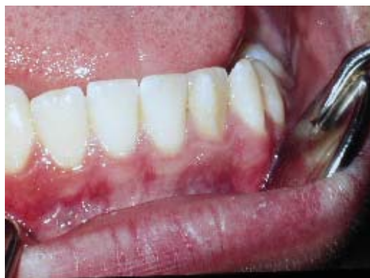
Fig. 1. Crecimiento anómalo de tejido dentario en la superficie vestibular del diente 3.2.

Anomalous dental tissue growth on the vestibular surface of tooth 32 (FDI)