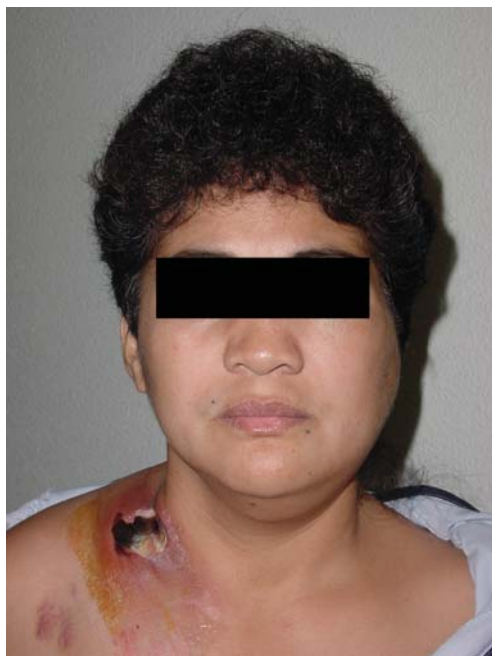
Fig.1. Imagen de la paciente durante su estancia hospitalaria presentando ligera tumefacción hemifacial izquierda y gran lesión supraclavicular derecha con área necrótica central. Image of patient in hospital with slight left side hemifacial tumefaction and large right supraclavicular lesion with necrotic central area.

Se realizaron diversas serologías, resultando positivas la IgG anti Toxoplasma, IgG anti VSH y VVZ, IgG anti Chlamydia pneumoniae e IgG anti Bartonella henselae, pero ninguna con títulos indicativos de infección actual. El resto de serologías, para Chlamydia psittaci y C. trachomatis, Hepatitis B y C, VIH, mononucleosis, leishmaniasis, sífilis y tularemia, resultaron negativas. El Mantoux, los cultivos de orina, del frotis nasal, de la lesión ulcerada supraclavicular, y hemocultivos (recogidos en picos febriles) también resultaron negativos, así como la extensión sanguínea en busca de formas parasitarias.