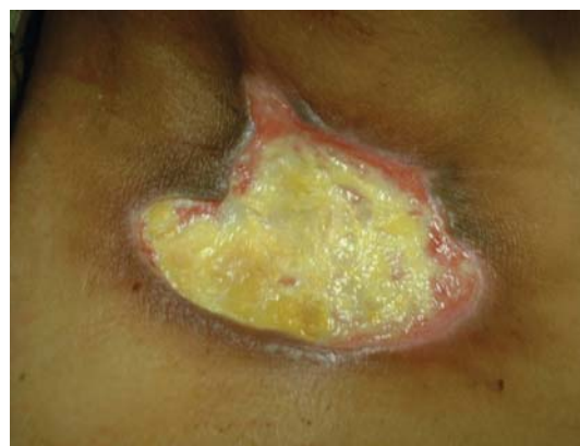
Fig. 3. Aspecto de la lesión supraclavicular derecha tras extirpación del área necrótica (para favorecer la cicatrización de la lesión). Aspect of right supraclavicular lesion after removal of necrotic area (in order to aid healing of lesion).