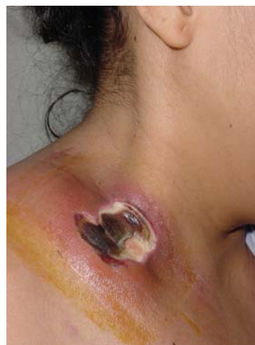
Fig. 2. Detalle de la escara necrótica supraclavicular derecha. Detail of right supraclavicular necrotic eschar.