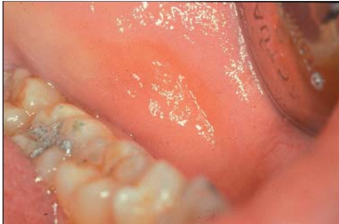
Fig. 1. Reacción liquenoide a la amalgama dental. Lesión erosiva-atrónica, ligeramente eritematosa, en la mucosa yugal que contacta con la restauración de amalgama de plata en el diente 37.

Una mujer de 38 años de edad solicitó asistencia odontológica para el tratamiento de la caries del diente # 37 (segundo molar mandibular izquierdo). En ese momento no presentaba antecedentes médicos ni odontológicos destacables, no estaba tomando ningún tipo de fármaco y no tenía ninguna otra restauración en su boca. Tras la revisión intraoral y el análisis de la radiografía periapical del diente en cuestión, se procedió a la eliminación del tejido afectado por la caries, realizándose una preparación cavitaria clase I de Black que se rellenó con amalgama de plata. No se produjo ningún problema postoperatorio.