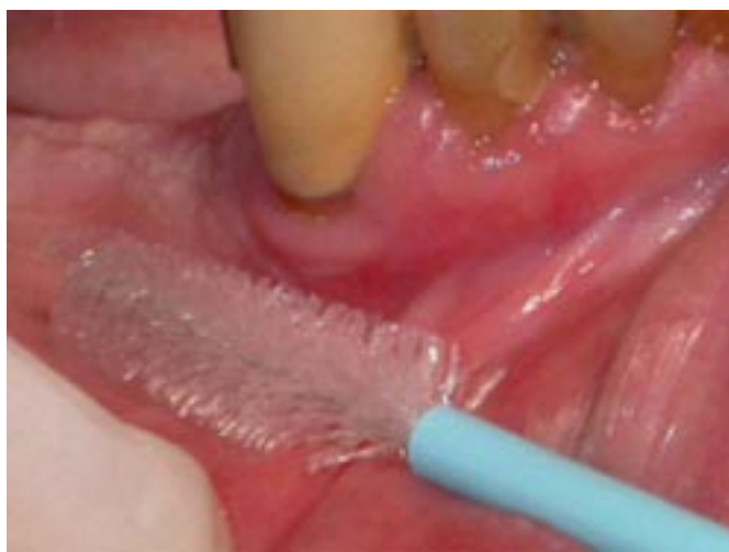
Fig. 1. Obtaining an exfoliative smear with the CytoBrush® (Atalab; Barcelona: Spain).

Toma de una muestra mediante CytoBrush® (Atalab; Barcelona: España).