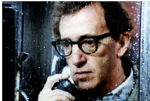
Hanna y sus hermanas

Si per eternitat s'entén no una durada temporal infinita, sinó la intemporalitat, llavors viu eternament qui viu en el present. La nostra vida és tan infinita com il·limitat és el nostre camp visual.