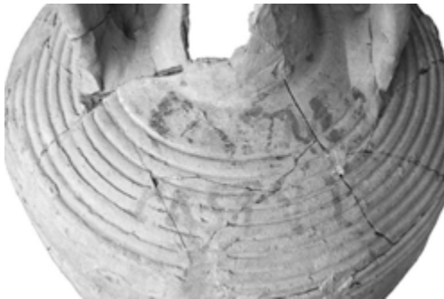
Cin(n)a Castul(onensis) (?)

Lletres: lín. 1: 2,3-3,5; lín. 2: ca. 2-6,6.