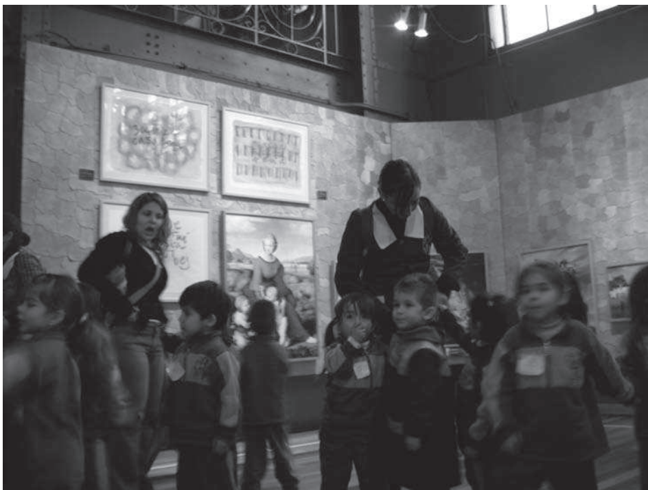
Fig. 7. Alumnado de educación infantil paseando por la muestra de Artequín con sus maestras.

iniciativa de montar un verdadero estudio de pintura en el museo para que el alumnado dibujase a sus maestras.