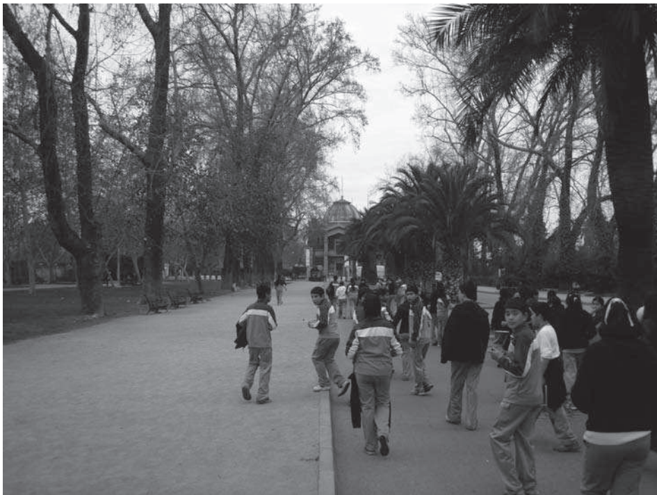
Fig. 5. El jardín de la Quinta Normal, por el cual se accede al Museo Artequín, está habitualmente repleto de escolares que se dirigen a visitar este peculiar centro de arte.

la dictadura). Seleccionamos fragmentos del testimonio de VB «Soy profesora de Artes Visuales y realizo clases en dos establecimientos emblemáticos municipales de Santiago: Instituto Nacional y Liceo de Aplicación. (...) A tu pregunta sobre la importancia de la educación, debo contarte que he tenido el privilegio de vivenciar grandes manifestaciones de parte de mis estudiantes, quienes, a partir del año 2006, generaron una fuerte movilización estudiantil denominada «revolución pingüina» (en Chile los estudiantes de educación secundaria utilizan un uniforme asociable a la imagen de un pingüino), en que, la pasión y reflexión de estos niños-jóvenes fue tan intensa que logró remecer a todo el país en pro de una exigencia elemental: Educación de Calidad para todos los estudiantes en Chile. (...) La experiencia que tienen mis alumnos con los museos, ha sido siempre valiosa (he recogido sus observaciones), y ha otorgado la posibilidad de desarrollar experiencias metodológicas muy profundas y significativas.»