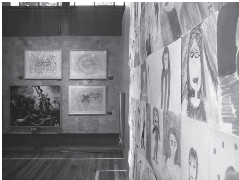
Fig. 8. Visión de un panel de dibujos del alumnado y una pared con la composición de cuadros del artista. Se intenta combinar de forma coherente la aportación de las diferentes miradas.

La exposición Mujeres Maestras de Chile está formada por tres espacios. Tres miradas a la mujer maestra, observaciones que se articulan desde tres perspectivas diferentes: la del artista, la del alumnado, y la de las propias implicadas como protagonistas, las mujeres maestras. A través de cuadros y pinturas, el artista interpreta a las mujeres de quienes aprende y continúa aprendiendo, reflexionando sobre su papel social. Autores de referencia como Henry Giroux, José Gimeno Sacristán o Pierre Bourdieu, han tanteado al colectivo docente, y nosotros accedemos a estas premisas con la intención de aumentar las referencias identitarias. Incidimos aquí en la cuestión de género, con una mirada que proviene de la masculinidad, ya que es la que aporta el artista; por otro lado está la aparición de una mirada múltiple desde la infancia, que converge en la aportación del alumnado. Introducimos desde la creación plástica una visión particular sobre las docentes gracias a una investigación educativa. Estas mujeres luchan con sus