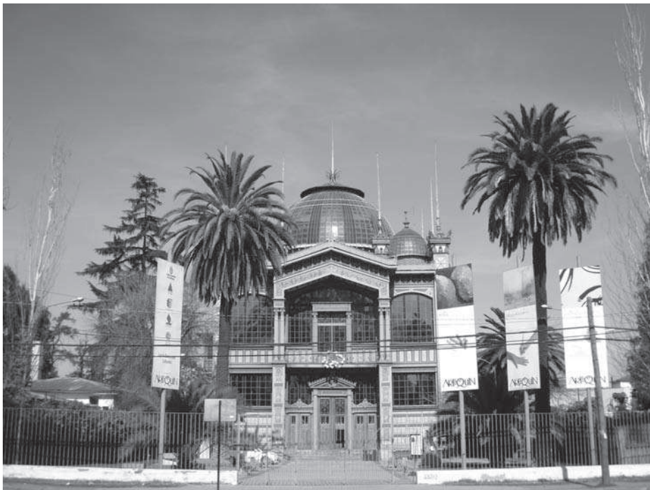
Fig. 1. El edificio del Museo Artequín es un magnífico exponente de la arquitectura más lúdica de finales del siglo XIX. Fue la sede del pabellón de Chile en la Exposición Universal de París de 1890.

donde se están instalando espacios de ocio para todos los públicos. También los jardines que rodean todo este complejo resultan muy atractivos para las familias y los grupos de visitantes. Desde la propia Fundación Artequín se fomenta la educación artística mediante programas y actividades dirigidos a públicos escolares.