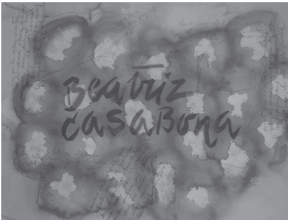
Fig. 6. Llegar a interpretar a las maestras mediante sus escritos personales supone un esfuerzo creativo e incluso de contención. La mayor recompensa se revela cuando las educadoras se ven identificadas en sus retratos.

Queremos defender que existe una gran carga afectiva en cada pieza pintada, ya que se rememora el papel importantísimo que asumen estas mujeres como educadoras. Sus nombres se leen aquí como un reflejo, como espejo de su imagen, y gracias a la musicalidad del texto adquieren resonancias particularmente auditivas. A muchas de estas mujeres las hemos conocido personalmente, aunque ha sido después de varios meses de contacto mediante correo electrónico o por conversaciones telefónicas. A través de sus textos nos aportan oportunidades de conocimiento. Con sus palabras van construyendo el engranaje de un sentido identitario particular.