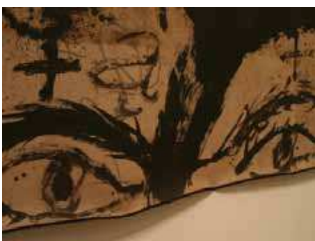
Figuras 7 y 8. Detalles de obras de Tàpies de la exposición "Certeses Sentides" (La Nau, Valencia, 2003)