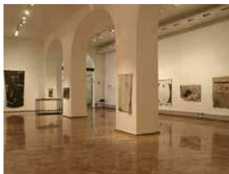
Figuras 5 y 6. Aspectos de la exposición "Certeses Sentides" que tuvo lugar en el Centre Cultural La Nau de la Universitat de València, con piezas inéditas elaboradas sobre materiales encontrados por el artista en su taller.