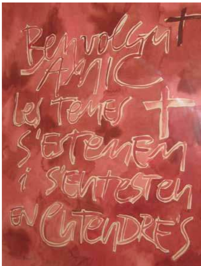
Figura 2. Esbozo de la pintura realizada por Ricard Huerta para el homenaje a Tàpies que comisarió el autor del artículo para la Universitat de Valencia en 2013.