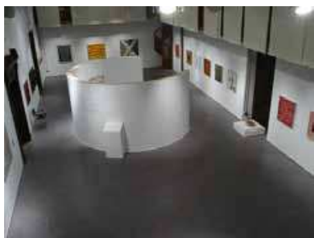
Figuras 3 y 4. Imágenes de la exposición homenaje a Tàpies que comisarió Ricard Huerta en el Centre Cultural La Nau de la Universitat de València en 2003.