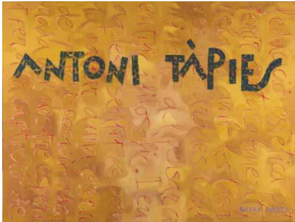
Figura 1. Pintura de Ricard Huerta dedicada a Antoni Tàpies, realizada en 2006.

de juego, muy importante; de hecho gracias a las teorías del juego se sabe que jugar puede ser algo educativo y trascendente. Como tengo un espíritu un poco juguetón, las críticas me las tomo bastante en broma. Según qué crítico la haya escrito le dedico más interés. A veces ni pienso en ello. Por suerte los críticos, los historiadores de arte y los directores de museos importantes hace muchos años que me tratan con respeto. No tengo queja en ese sentido. Me río con los columnistas que hacen mucha broma.