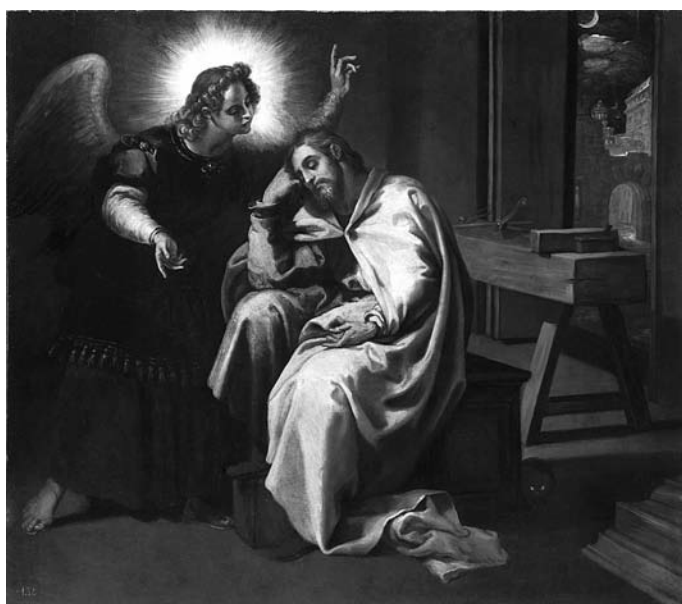
Fig. 1. El somni de sant Josep , Francesc Ribalta, 1608-1610, Madrid, galeria Caylus.