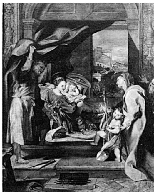
Fig. 10. Sagrada Família , còpia de d'una obra desapareguda de Barocci (1535-1612), col·lecció particular.

Així doncs, aquest gat negre que s'entreveu al costat del sant, ocult entre les ombres, podria ser un símbol del mal, dels mals pensaments que passen pel cap de Josep, de la temptació d'abandonar la seua dona i repudiar-la en secret, pensa-