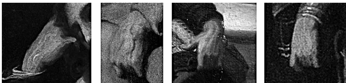
Fig. 6. D'esquerra a dreta. Mà dreta de sant Josep, El somni de sant Josep . Mà esquerra de sant Pere, El lavatori de peus , retaule major. Mà esquerra d'un doctor, Crist entre els doctors , retaule de Sant Josep. Mà esquerra d'un soldat, La degolla de sant Jaume , retaule major.