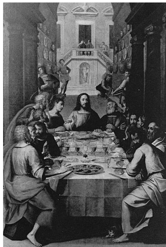
Fig. 11. Sant Sopar , anònim genovès, segle XVI, València, Col·legi del Corpus Christi.

Com hem vist, l'estudi de les diferents parts que componen i engloben tot allò relacionat amb l'obra retrobada han dut a investigacions molt interessants on s'ha pogut descobrir un poc més les diferents facetes de l'obra i de l'artista que la pin-