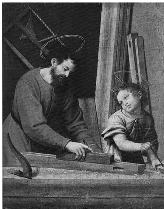
Fig. 8. Sant Josep i l'infant Jesús , Joan de Joanes, segle XVI, Berlín, Gemäldegalerie Staatliche.

Un altre element prou interessant que apunta Gracián 68 són els diferents tipus de fusters que hi havia: el primer és el que anomena carpinteros