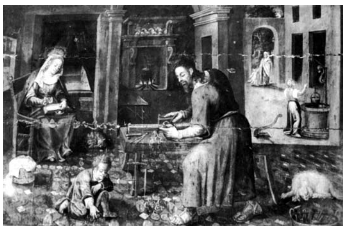
Fig. 9. Taller de sant Josep , Cristóbal Llorens, 1612, Alaquàs, església parroquial de l'Assumpció, retaule de Sant Josep.

Però, a banda de tot això, tal vegada l'element més singular d'aquesta obra siga el gat negre que apareix, quasi amagat, en les ombres del banc on seu el sant. I és singular perquè no el trobem a cap font 69 ni en cap altra representació d'aquest passatge, almenys que coneguem. Aquest gat el podem interpretar de diverses maneres. Una primera possibilitat pot ser establir una separació de dos escenes dins d'una mateixa composició, és a dir, d'una banda podem parlar del que és pròpiament el somni , i d'una altra podem parlar del taller , perquè tampoc és freqüent que aquest episodi es desenvolupe en aquest lloc: el somni de sant Josep es representa en un exterior o en un interior, però quan és un interior normalment no es pot reconèixer l'espai concret. Es podria pensar que ací el que fa Ribalta és sintetitzar dues escenes en una: el taller i el somni . De fet, l'obra del taller de sant Josep apareix en un retaule proper cronològicament i espacialment com és el de sant Josep d'Alaquàs, obra de Cristóbal Llorens de 1612 [Fig. 9], i curiosament en aquesta obra apareix també un gat i, a més, un gos. És a dir, que tal vegada, si la voluntat de Ribalta era barrejar el somni i el taller , és possible que prenguera també algun element freqüent en les escenes de taller, com són els animals, un