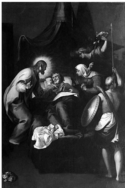
Fig. 3. Mort de sant Josep , Francesc Ribalta, 1608-1610, Algemesí, església parroquial de Sant Jaume, retaule de Sant Josep.

Parant atenció ara en la figura de sant Josep, si ens fixem en el seu cap, representat de tres quarts, i la seua inclinació, trobarem una certa semblança amb el cap de sant Jaume en La degolla de sant Jaume , o amb el del Crist al Calvari ,