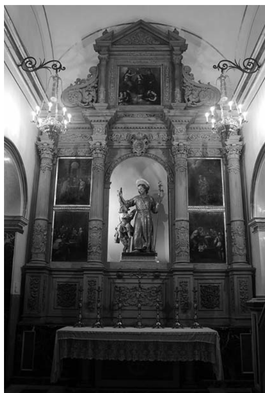
Fig. 2. Retaule de sant Josep, Algemesí, església parroquial de Sant Jaume. Estat actual.

La primera cosa que hem de tindre en compte és que somnis de sant Josep, en l'Evangeli, podem trobar-ne fins a tres diferents, tots ells narrats per