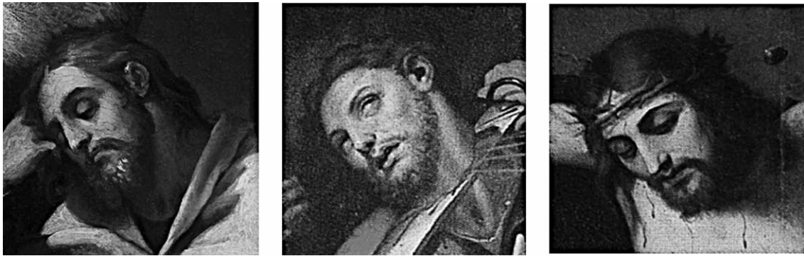
Fig. 4. D'esquerra a dreta. Rostre de sant Josep, El somni de sant Josep . Rostre de sant Jaume, La degolla de sant Jaume , retaule major. Rostre de Crist, El calvari , retaule del Sagrat Cor de Jesús.

També en les posicions dels peus podem trobar diferents semblances: així, el peu dret de l'àngel, amb el dit gros per damunt de la resta, el trobem també, girat, en el sant Jaume de La batalla de Clavijo , en el Sant Onofre –els dos del retaule major– i en el Sant Joan de la sèrie d'Evangelistes [Fig. 7]. També en aquesta sèrie podem veure que el peu esquerre de Sant Lluc és molt paregut a l'esquerre de l'àngel.