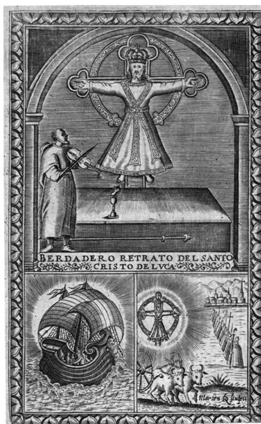
Fig. 1. Bernardino Blancalana, Historia de la sagrada imagen de Christo crucificado que esta en la nobilissima ciudad de Luca . Madrid, 1638.

La devoción a la talla luquesa hizo que se prodi-gara su advocación por la cristiandad. Por ejemplo, Francisco Pacheco destacó en la primera mitad del siglo XVII los casos de la catedral de Valencia y del convento de Atocha de Madrid. 23 En la sede valenciana había un altar dedicado al sancti Vultus en 1467, y en 1494 se edificó en el acceso a la antigua aula capitular la capilla del crucifijo o Santo Bulto de Jesús (incorrecta traducción de Volto Santo ), que con la reforma del XVIII se trasladó a otro lugar. 24 Por cronología, podemos considerar que la devoción al Volto Santo de Lucca arraigó en la catedral de Valencia en contacto con la devoción al Cristo de Beirut, presente desde que se inició su construcción en 1262 por fray Andrés de Albalat, su tercer obispo. Tiempo después se llevó al convento de Madrid una copia de la imagen de Lucca que alcanzó gran devoción y dio