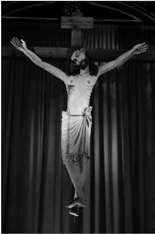
Fig. 3. Cristo del Salvador, parroquia del Salvador, Valencia, siglos XIII-XIV.

hostiga al converso. 68 Además, supuso una adaptación a través de la transferencia de acusaciones a otras religiones. Para el cristianismo y después el catolicismo los judíos fueron la raíz del herético movimiento iconoclasta, pero añadieron nuevas ramas a las que se adaptaron las narraciones sobre los anteriores. 69 Como frontera más permanente de conflicto la intensidad de las críticas se centró en musulmanes y moriscos, incluso en protestantes.