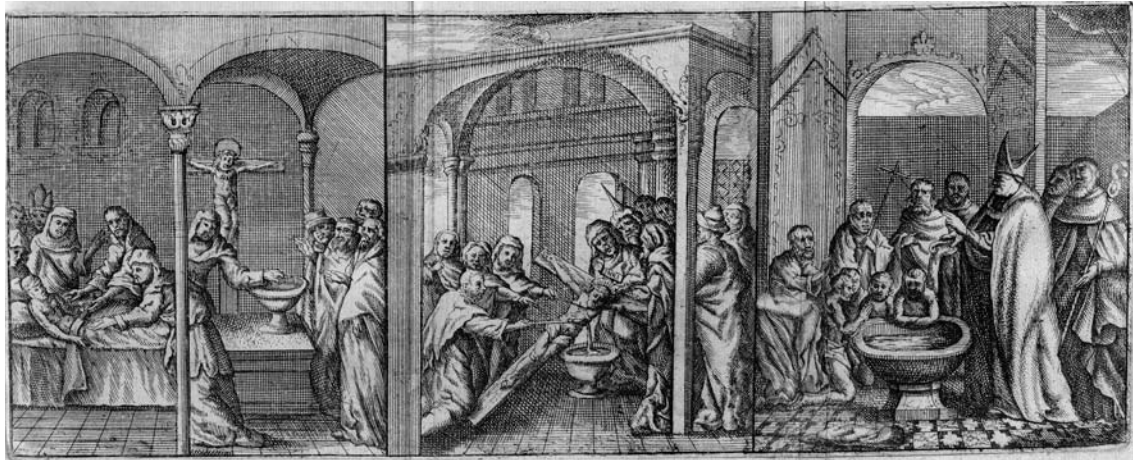
Fig. 2. Retablo de la capilla Passio Imaginis, catedral de Valencia en la obra de Juan Bautista Ballester, Identidad de la imagen del S. Christo de S. Salvador de Valencia . Valencia, Gerónimo Vilagrassa, 1672, pp. 454-455.

bautismo, como hemos visto favorecía el tema. De hecho, parece relevante en la iconografía del retablo el tamaño que ocupa el recipiente en el que se recogen los fluidos emanados, pues a diferencia de otras representaciones de este tema donde se contienen en un cáliz, con referencia a la Eucaristía y al dogma de la transustanciación, en este retablo el recipiente es una pila, por lo que se crea una relación más próxima al bautismo, una aspiración que impulsó los asaltos a juderías en 1391 y mantuvo la predicación de fray Vicente Ferrer. De hecho, con diferencia de escala la pila se repite en las tres escenas. Insiste en esta idea la representación de dos de los judíos repitiendo la acción de los soldados romanos Longinos (con lanza) y Stefatón (con caña y esponja empapada en vinagre), puesto que de los gestos que parecen guiar al primero se infiere que se sigue la leyenda medieval que aseguraba que Longinos era prácticamente ciego, y que en contacto con la sangre y el agua del Salvador que salió cuando atravesó su costado recuperó la vista y se convirtió.