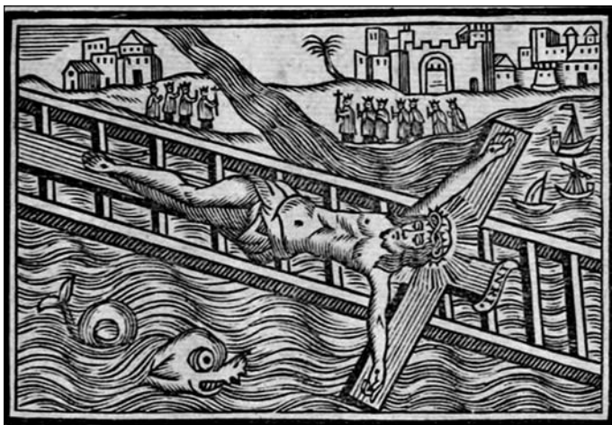
Fig. 5. Gozos del santísimo Christo del Grao, para sus Cofrades, y Devotos. Valencia, Imprenta de Joseph Estevan, entre 1773 y 1794.

1631. Ambos soportan la defensa de las imágenes y el principio horaciano en textos de la tradición cristiana, ambos defienden el uso de imágenes y ambos escriben sus obras como reacción a la destrucción de las sagradas, aunque con distinto estímulo geográfico: mientras Prades dirige sus críticas a los herejes de Francia, Alemania e Inglaterra, fray Juan Andreu de S. Joseph las dirige a los musulmanes.