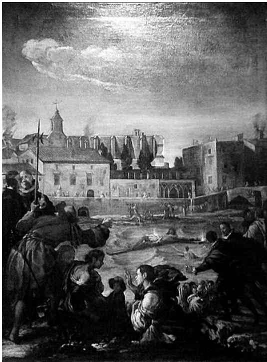
Fig. 4. Juan Conchillos Falcó (atribuida) Rescate del Cristo de Berito , de finales del siglo XVII. Museo de Klausen (Provincia de Bolzano, Italia).

los piratas berberiscos llevaron a cabo similares profanaciones en Paiporta.