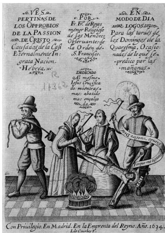
Fig. 6. Francisco de Rojas Nieto, Vespertinas de los opprobios de la Passion de Cristo causados de la casi eternamente ingrata nación hebrea, en modo de diálogos para las tardes de los domingos de la quaresma, ocasionados de lo que se predicó por las mañanas . Madrid, imprenta del Reyno, 1634.