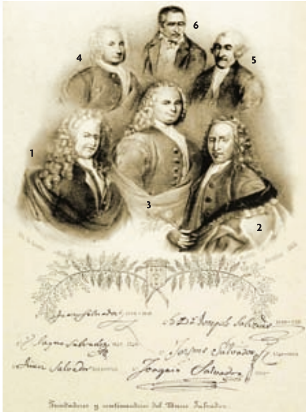
Biblioteca de l'Institut Botànic de Barcelona

Els Salvador foren, sens dubte, la nissaga més famosa de naturalistes catalans. Al gravat, fundadors i continuadors del Museu Salvador, de baix a dalt i numerats: 1. Joan Salvador i Boscà (1598-1681). 2. Jaume Salvador i Pedrol (1649-1740). 3. Joan Salvador i Riera (1683-1726). 4. Josep Salvador i Riera (1690-1761). 5. Jaume Salvador i Salvador (1740-1805). 6. Joaquim Salvador i Burgès (1766-1857).