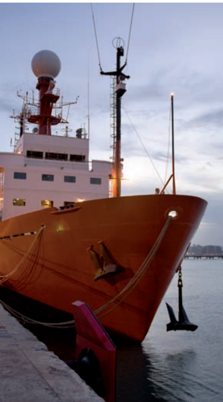
La campanya MOC2-Equatorial es va realitzar a bord del vaixell de recerca oceanogràfica Hespérides des de Fortaleza (Brasil) fins a Mindelo (Cap Verd). En total van ser 42 dies de navegació durant l'abril i el maig del 2010 a l'oceà Atlàntic tropical i equatorial en el qual van participar investigadors de diverses institucions nacionals i internacionals.

del Nord de Brasil transporten grans quantitats de calor cap a les regions més septentrionals de l'Atlàntic i permeten, entre altres coses, que l'Europa meridional tingui un clima suau. Part d'aquest flux de calor ve de l'oceà Índic, que és un oceà tancat pel nord, per la qual cosa tota la calor radiativa emmagatzemada a la regió tropical ha d'anar cap al sud i pot parcialment escapar vers l'Atlàntic mitjançant el corrent d'Agulles, però una gran part ve precisament de l'escalfament de les aigües antàrtiques durant el seu trànsit per l'Atlàntic sud i equatorial.