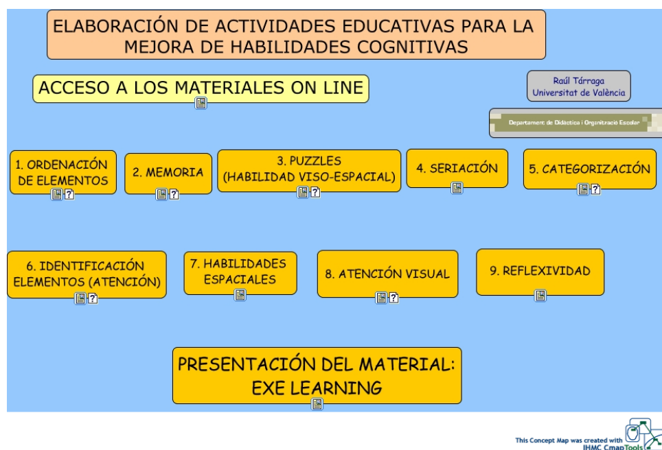
Gráfico 1. Ejemplo de mapa conceptual como índice de una sesión de trabajo

En el Gráfico 1 podemos ver un ejemplo de lo que acabamos de comentar. Este sencillo mapa conceptual sirve de índice a los estudiantes para estructurar una sesión en la que se utiliza la tecnología educativa, basada en los mapas conceptuales, en la asignatura de Necesidades Educativas Especiales en el Grado de Maestro de Educación Infantil y de primaria, y en la que se abordan los procedimientos para elaborar diferentes tipos de actividades para el entrenamiento de habilidades cognitivas básicas.