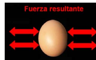
Fig. 2c. Fuerza resultante

Comentarios y sugerencias: Este principio se puede ilustrar también con ayuda de la demostración 3 (el ludión). Cuando ejercemos presión sobre la botella, el agua transmite la presión al ludión en todas direcciones, comprimiéndolo y haciendo que aumente su densidad y se hunda. Como se ve también en la demostración 4 (Hemisferios de Magdeburgo), el Principio de Pascal se aplica a nosotros mismos que vivimos en un océano de aire. La columna de aire de la atmósfera sobre nosotros ejerce una presión de 10 toneladas/m 2 . Sin embargo, como se transmite a todos los puntos que nos rodean con el mismo valor, el resultado es que la fuerza que se aplica sobre nosotros es igual en todas direcciones. Entonces la fuerza se anula y no notamos la presencia de la atmósfera.