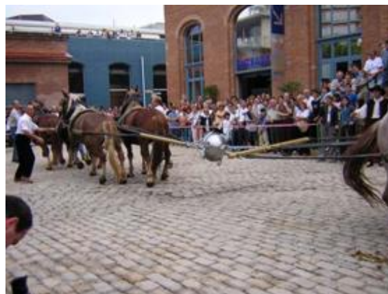
Fig 3. Reproducción de la experiencia de Otto von Guericke en el museo de la Ciencia y la Técnica de Cataluña (Terrassa, Nov. 2003).