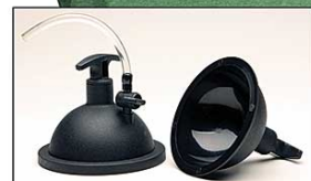
Fig 1. Hemisferios