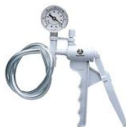
Fig 2. Bomba de vacío manual