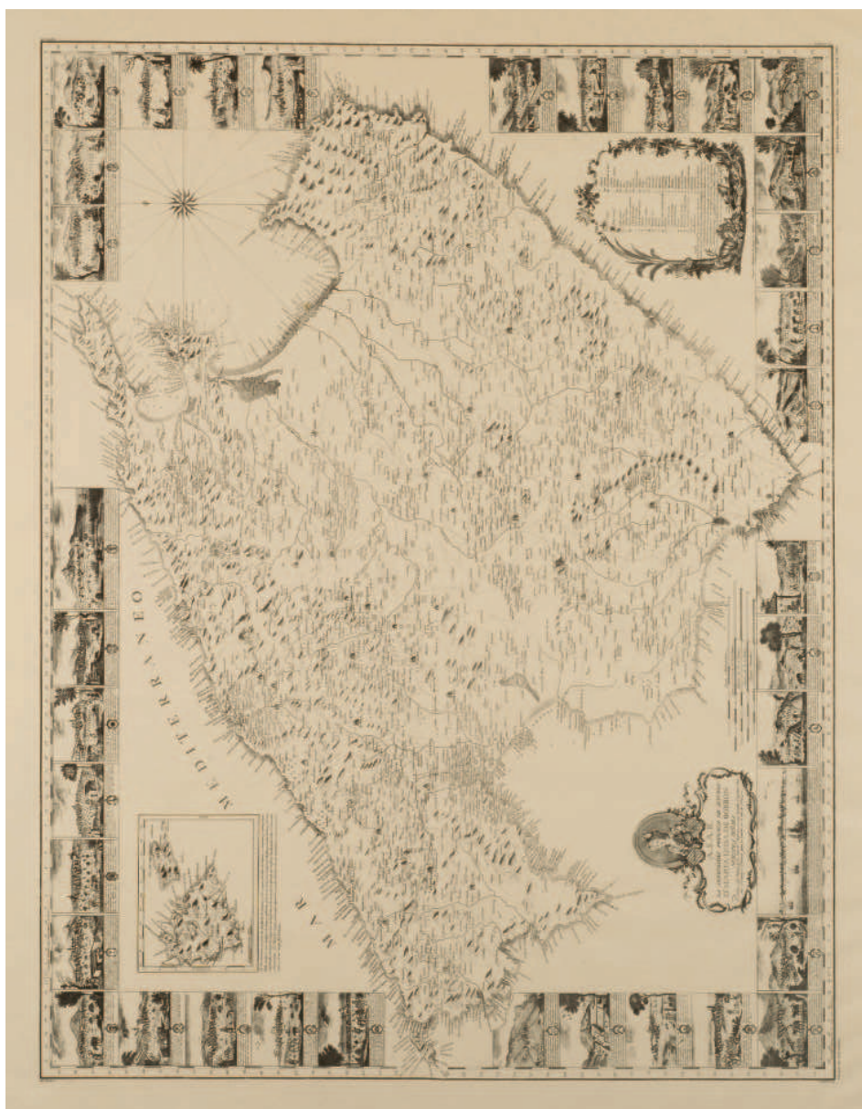
Figura 1. Mapa de l'Illa de Mallorca, patrocinat per Antoni Despuig i Dameto (1784-1785).