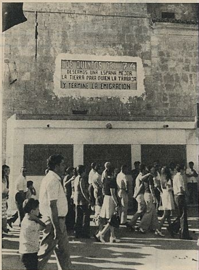
Con fondo rojo y gualda, una pancarta que testimonia de la creciente toma de conciencia del agro español.