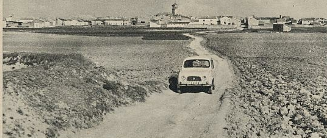
Posada en la llanura, curtida de estíos y cierzos, Villamalea.

salir con él a la calle para constatar el afecto y confianza que le tienen sus convecinos.