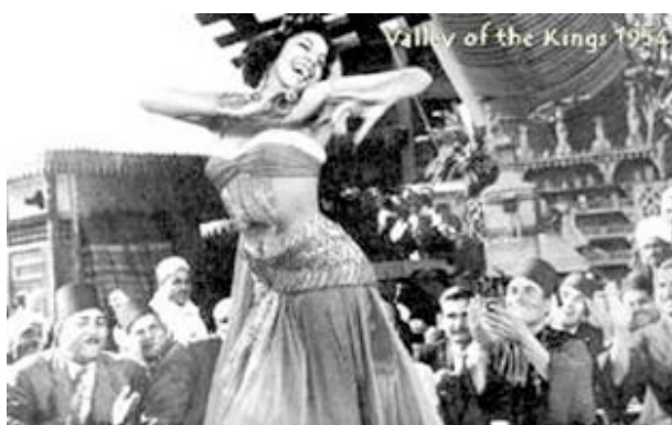
Samia Gamal 10

Las guerras mundiales supusieron la interrupción de la producción de espectáculos y la inestabilidad de los espacios de ocio en las capitales europeas, cuyo testigo fue tomado por algunas capitales de Medio Oriente. En estas circunstancias, la danza oriental pasó a buscar su legitimación como producto nacional para lo cual intentaría alejarse de los estereotipos metropolitanos de la danza. El Raqs Sharki u Oryantal Dansi , como se la conoce en árabe y turco respectivamente, aparece entonces como un estilo diferenciado de las expresiones folklóricas. Se configuraría como una danza exclusivamente femenina e individual, originalmente improvisada, que siguiendo las tendencias introducidas por las audiencias europeas, pasó a desarrollarse en el marco del cabaret, salas de fiesta y el cine. La danza oriental en ciertos países, como Egipto, Líbano y Turquía, instauró modelos de representación con los