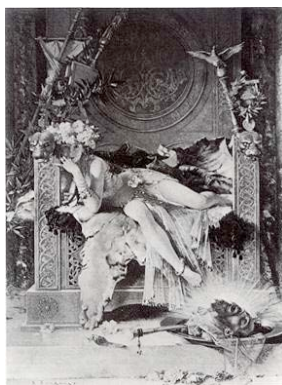
Salomé Triumfante de Édouard Toudouze (1886) 3