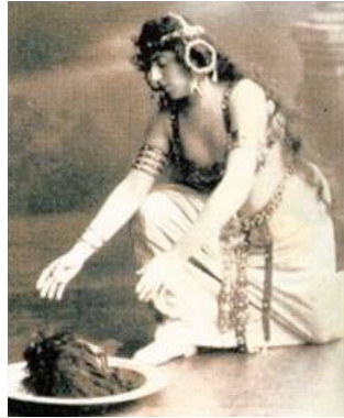
Oscar Wilde como Salomé 1