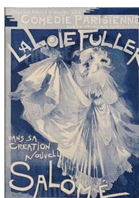
Carteles Publicitarios de representaciones de Salomé 9